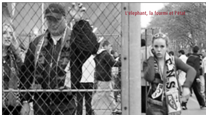
L'éléphant, la fourmi et l'état

Entrée : 5 € - 4,5 € (membres Cinédit) et 1,25 € (art 27)