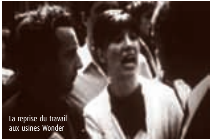
La reprise du travail aux usines Wonder