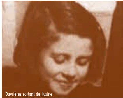
Ouvrières sortant de l'usine