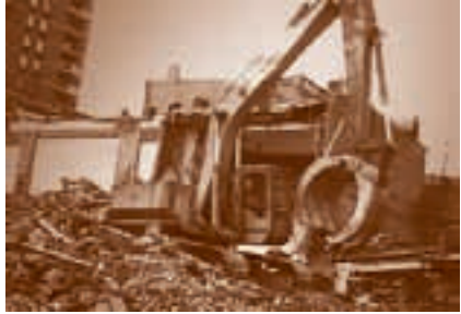
The Last customer