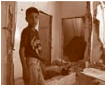
Tweety lovely superstar

Une jeune femme travaille comme hôtesse de promotion pour une marque de biscuits dans un supermarché polonais et propose à longueur de journée des dégustations aux passants. Ce film est issu de la série 'Le Silence' réalisée par des étudiants de l'École Supérieure de Réalisation Cinématographique Andrzej Wajda à Varsovie.